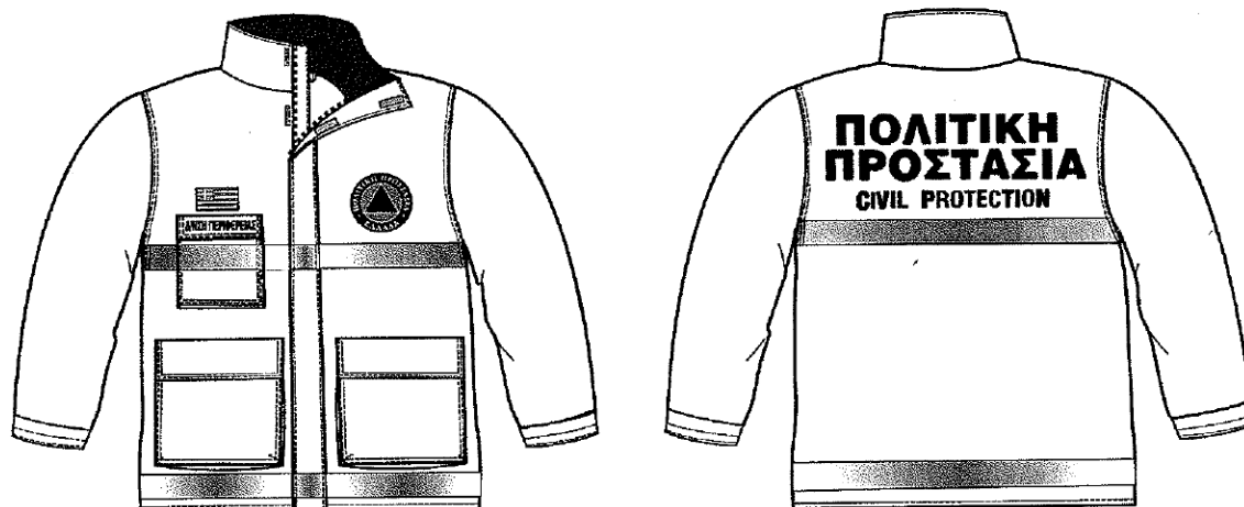
Εικόνα 1. Επιχειρησιακά μπουφάν Πολιτικής Προστασίας

Σύμφωνα με το 4678/22-11-2004 έγγραφο ΓΓΠΠ, τα επιχειρησιακά μπουφάν Πολιτικής Προστασίας θα πρέπει να έχουν την ακόλουθη μορφή: